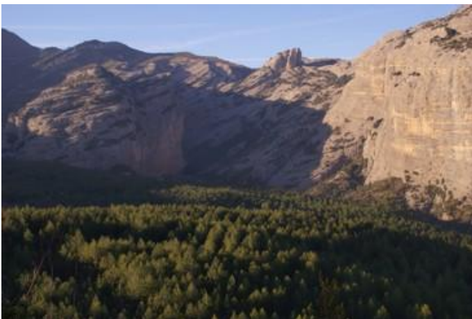
Mallos de Lazas y Los Pepes

Paseo circular por el Camino Natural de Vadiello en el que nos acercaremos a lo “David Attenborough” para descubrir los sentidos de las plantas y los paisajes sorprendentes de los Mallos. Desde el aparcamiento situado justo antes del refugio de Peña Guara en Vadiello, iniciaremos la ruta por el bosque de repoblación de pino laricio que está bordeando los impresionantes Mallo de Lazas. En el bosque descubriremos que los árboles nos están oliendo, viendo y sintiendo con más sentidos de los que poseemos nosotros. Descubriremos el paisaje desde otra perspectiva, desde los seres que por estar fijos en un solo lugar han conseguido adaptarse formidablemente al medio. De forma paralela podremos examinar rocas que nos describen los paisajes en los que surgieron algunas de estas plantas. Durante buena parte del recorrido, que tiene casi siempre una agradable sombra, tendremos vistas sobre los Mallos de Lazas y de los Pepes; y del embalse de Vadiello.