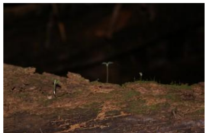
Plantas colonizando nuevos espacios