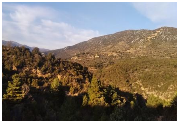
Vistas a la Sierra de Guara