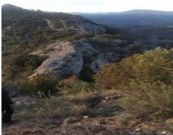
Crestas de Marmañana

Recorrido circular por el paisaje abrupto de la zona norte del Valle de la Gloria poblado de carrascas y quejigos, de cañones y badinas del río Formiga, de las crestas de conglomerado, como la de Marmañana, que es coronada por las ruinas de un Castillo que nos cuenta su historia de frontera medieval. La ruta comienza en el Camping de Panzano. Tomando el antiguo camino a Labata, que se divisa desde el Portillo, nos desviaremos para tomar el camino a Yaso. Veremos una antigua tejería muy bien conservada, hasta acercarnos al profundo y peligroso Cañón del Gorgonchón, bordeándolo por la Cresta de Marmañana. Habrá que descalzarse para cruzar el río Formiga y tomar el camino de vuelta a Panzano, descubriendo restos de un despoblado.