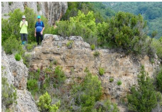
Ruinas del castillo de Labatiella