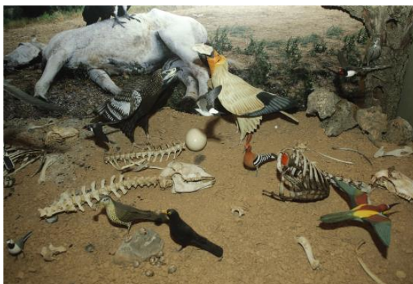
Casa Museo del Buitre

Este muladar es para alimentar a los quebrantahuesos, aunque se ha llegado a observar a los cuatro buitres europeos a la vez (buitre leonado, buitre negro, alimoche y quebrantahuesos)