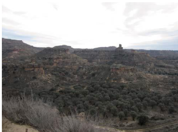
Panorámica de la Serreta de Tramaced