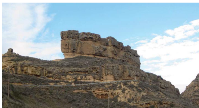
Peña de Mediodía

En la estepa de Piracés puedes encontrar avifauna estival como el abejaruco o el alcotán y otras que se encuentran todo el año como el búho real y águila real