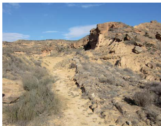
Restos de la calzada romana Osca- llerda