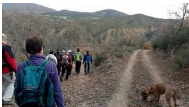
Camino de bajada al Río Formiga.