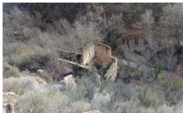
Ruinas del molino / central eléctrica.