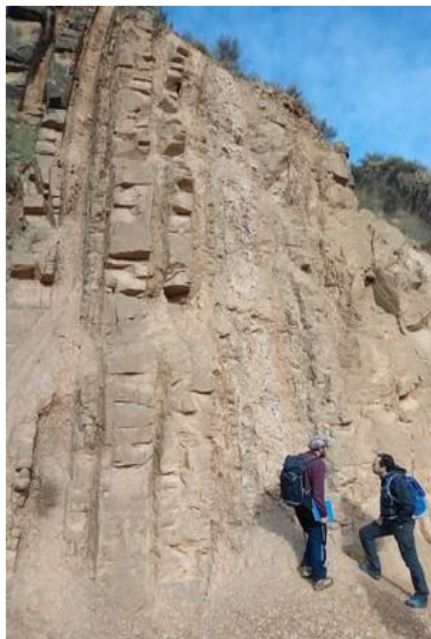
Estratos verticales, el final del Anticlinal de Barbastro.

Duración total de la jornada: 3 horas la excursión + 1 hora la visita a la quesería.