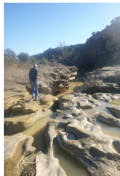
Paso del río erosionado