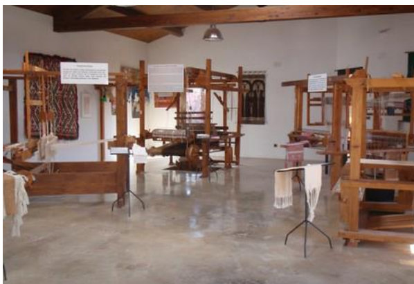
Telar de Triste