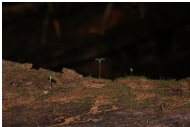
Plantas colonizando nuevos espacios.