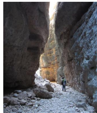
Gorga de San Julián