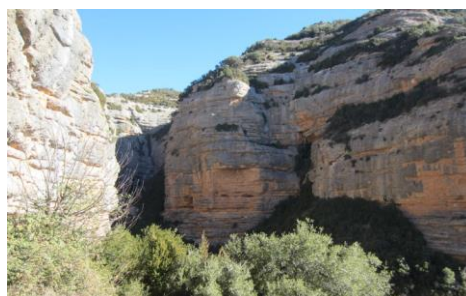
Paredes de conglomerado

¿Sabías que...? La vegetación es diferente según la orientación de la ladera, en la solana la vegetación es escasa y de bajo porte y en la umbría es más abundante y de mayor porte.