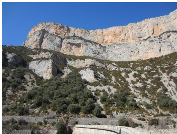
Acantilados de Cienfuens.