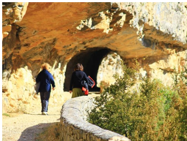
Uno de los túneles del camino.

La presa de Cienfuens se construyó para recoger el agua que se filtraba a través de las rocas calizas sobre las que se asienta la presa de Santa María de Belsué aguas arriba.