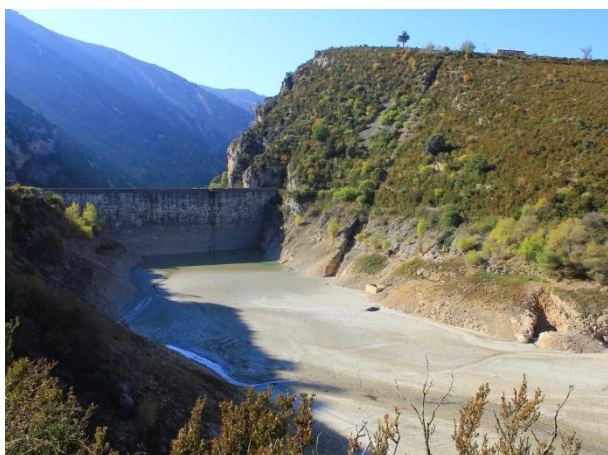
Embalse de Santa María de Belsué.