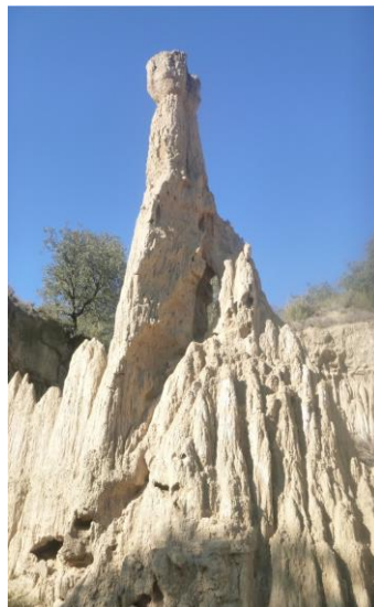
Chimenea de hadas.

Las chimeneas de hadas se forman cuando una roca más dura está sobre un sustrato más blando, este se erosiona y la roca dura hace de “paraguas” que evita parte de la erosión del material.