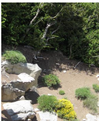
Erizón en floración.