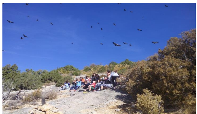
Buitres llegando al muladar.