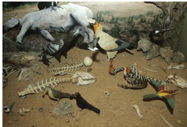
Casa Museo del Buitre

Este muladar es para alimentar a los quebrantahuesos, aunque se ha llegado a observar a los cuatro buitres europeos a la vez (buitre leonado, buitre negro, alimoche y quebrantahuesos)