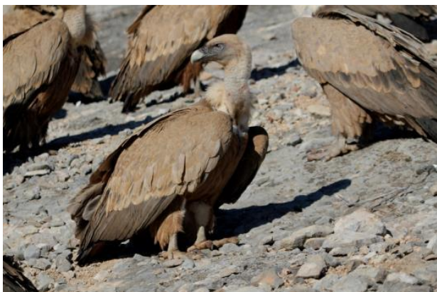
Buitre leonado en el muladar.