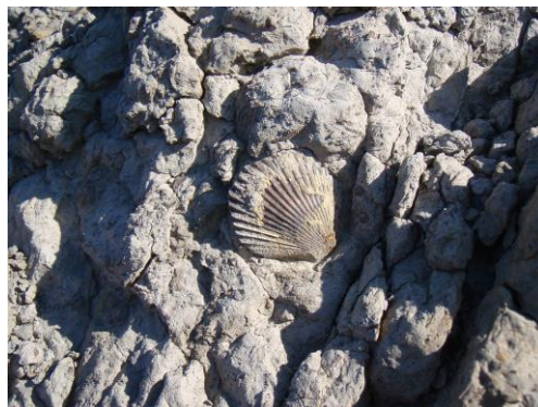
Margas con fósiles.

Las margas se generan en los fondos marinos y por eso contienen fósiles de las especies que habitaban las aguas.