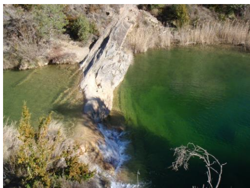
Pozas de triste.