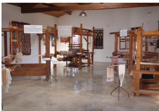
Taller textil de Triste.