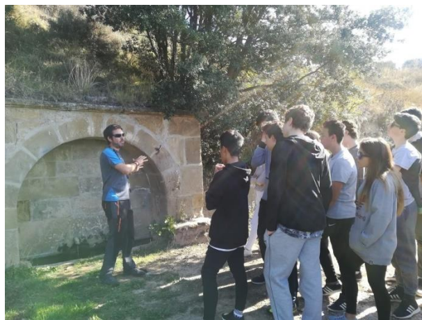
Fuente de los Huertos.

El edificio Espacio Salto de Roldán tiene un especial diseño arquitectónico por el que recibió el premio García Mercadal de Arquitectura en su 27ª edición.