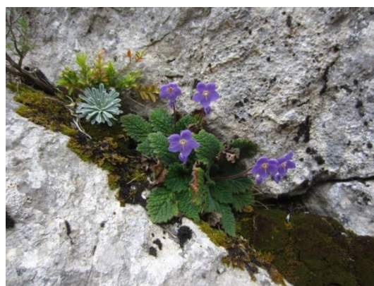
Corona de rey y oreja de oso.