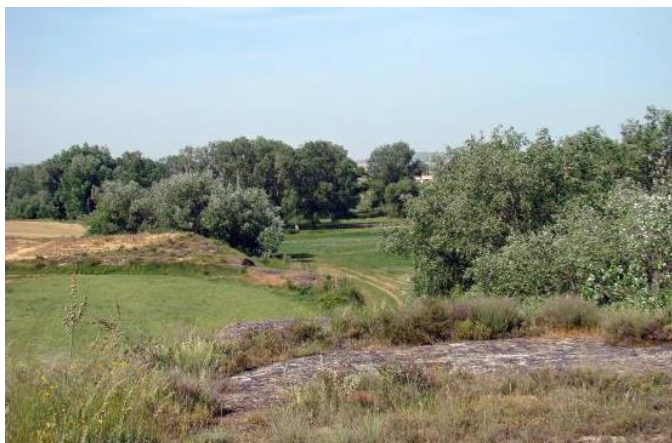
Soto de Buñales.