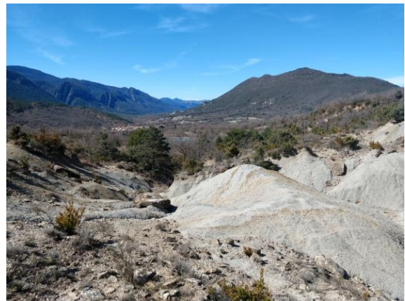
Vista del valle del Garona.

Rasal es muy conocido por sus aguas. No te puede ir sin beber agua de excelente calidad en la fuente con cuatro cabezas de león.