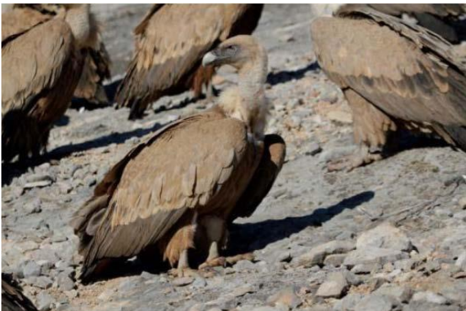
Buitre Leonado en el muladar.