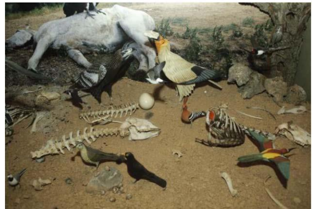
Casa Museo del Buitre

Este muladar es para alimentar al quebrantahuesos, aunque se ha llegado a observar a los cuatro buitres europeos a la vez (leonado, negro, quebrantahuesos y alimoche).