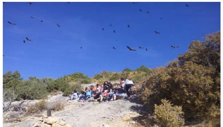
Buitres llegando al muladar