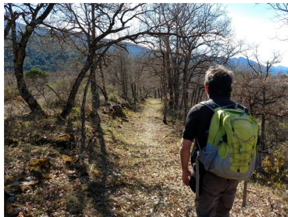
Caminando entre quejigos.