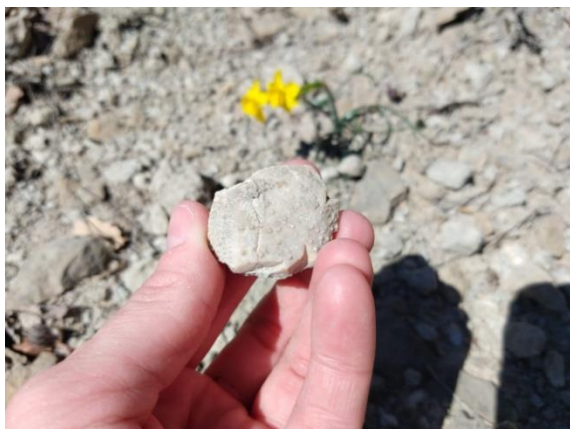
Fósil de erizo marino.