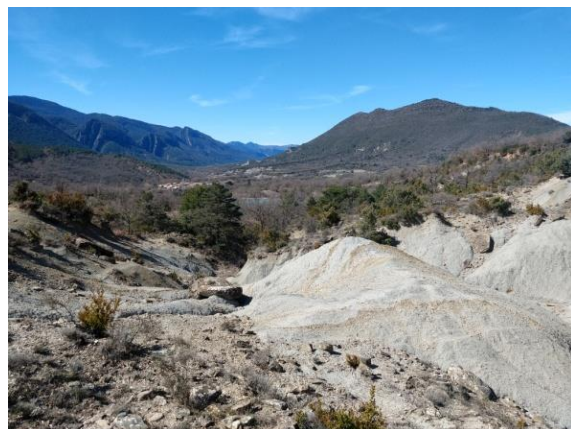
Vista del valle del Garona.

Rasal es muy conocido por sus aguas. No te puede ir sin beber agua de excelente calidad en la fuente con cuatro cabezas de león.