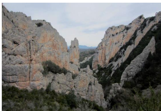
Estratos verticales de la Foz de Salinas.