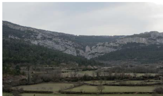
Foz de Salinas desde Villalangua.

La formación de la Foz ha sido debida a la fuerza erosiva sobre la roca del río Asabón.