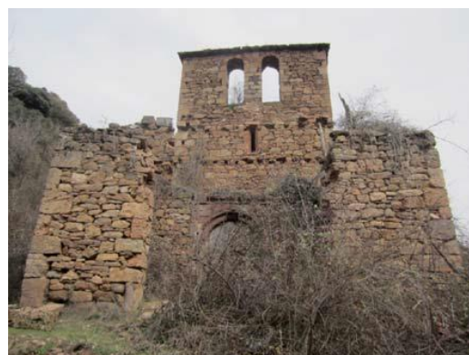
Iglesia del pueblo deshabitado de Salinas Viejo.