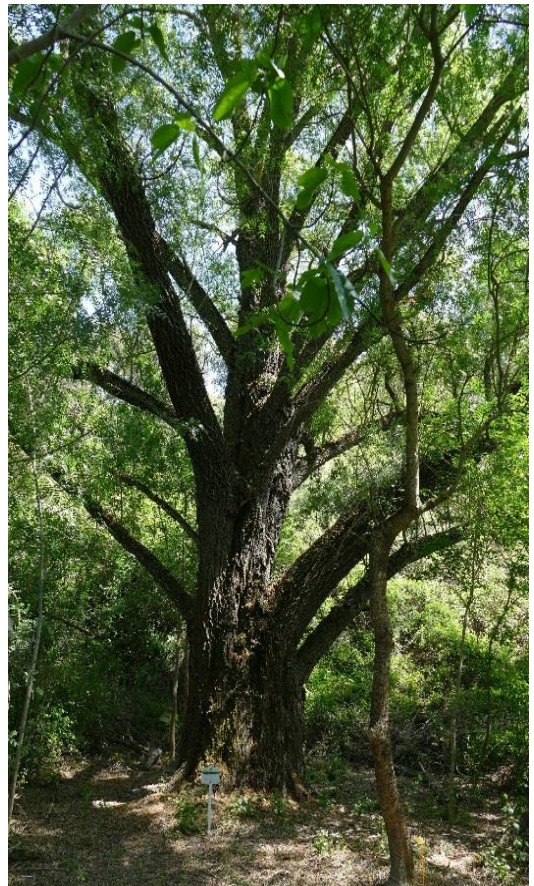
Salix alba .