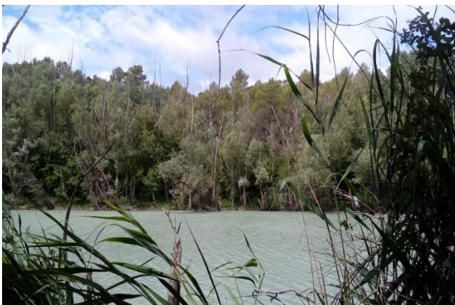
Bosque de ribera.

Durante la ruta te puedes encontrar con los árboles de donde se extrae el principio activo de la "aspirina".