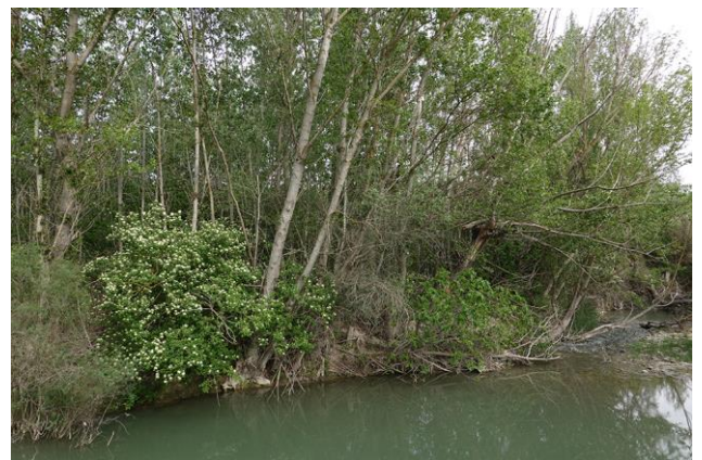
Soto de ribera.

El origen de tan peculiar nombre se remonta a los griegos, concretamente el río Maiandros que presentaban estas curiosas formas, pasando al latín como Meander.