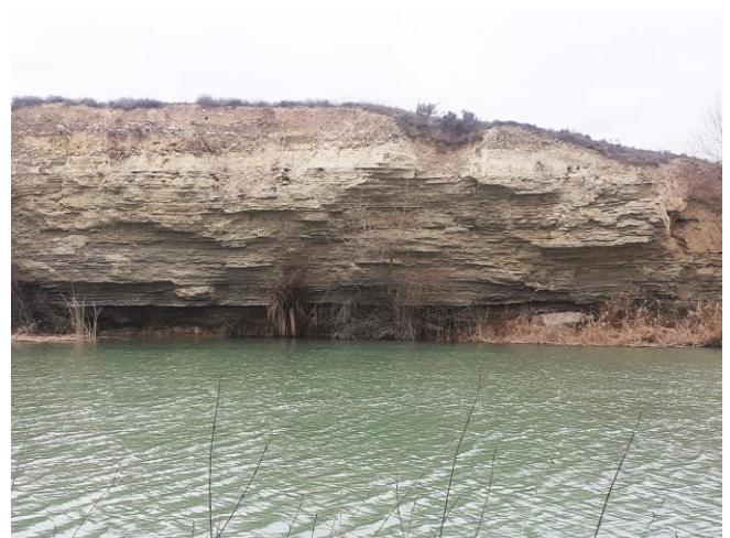
Estratificación horizontal en la orilla del río.