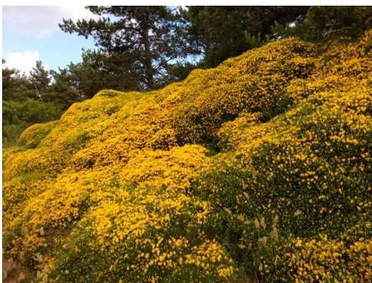
Erizón en floración.