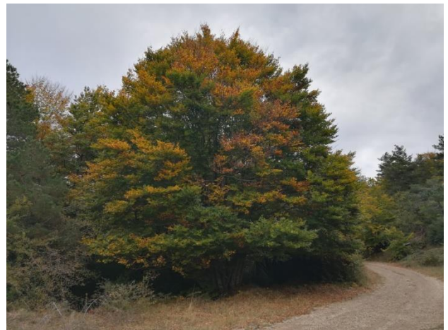
Haya comenzando a cambiar de color.

La quema de matorrales favorece al erizón, ayudándole a recolonizar al cabo de unos años.