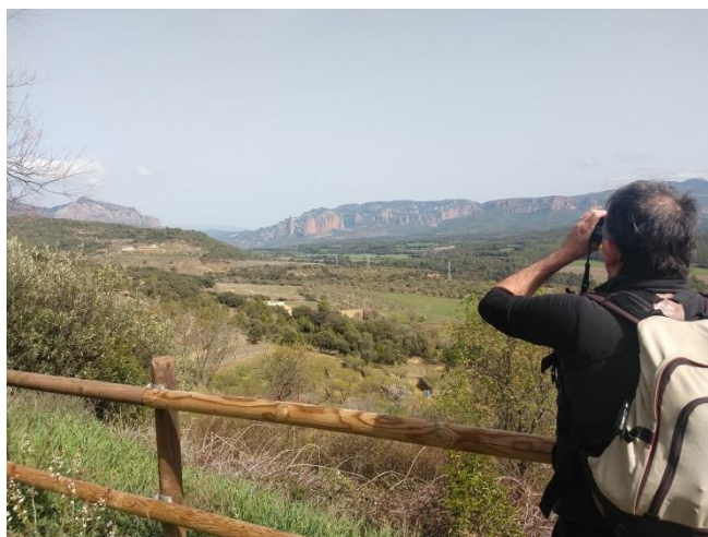
Mirador de San Pedro

Tradicionalmente el trabajo de traída de agua a los hogares antes lo hacían las mujeres y los niños.