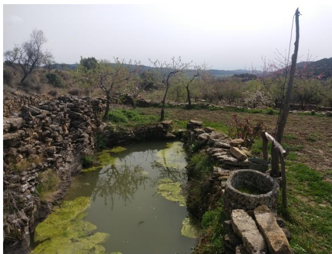
Huerto con quinquinflón