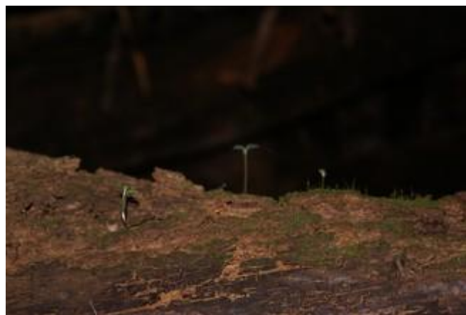
Plantas colonizando nuevos espacios.