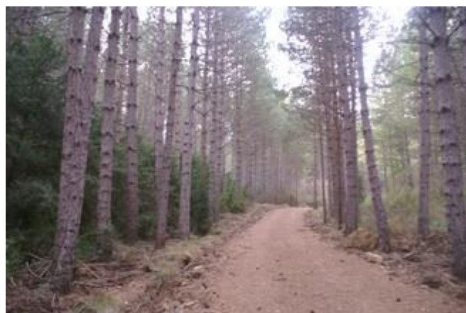
Bosque de pino laricio.

Los bosques de la Sierra de Guara están llenos de plantas tropicales, descúbrelo durante la ruta.