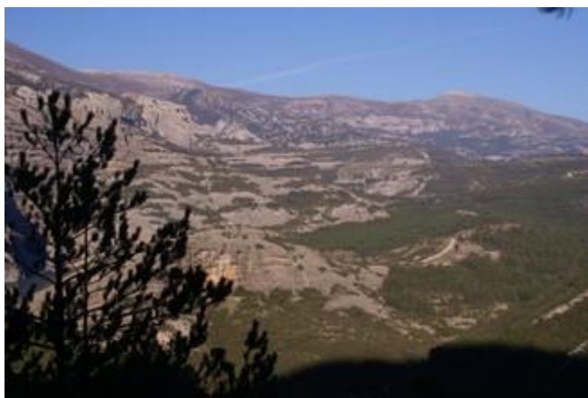
Sierra de Guara y Vadiello desde la ruta.