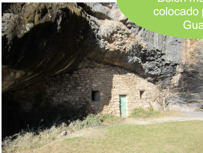
Ermita de San Julián.

En la gorga hay un Belén montañoso colocado por Peña Guara.