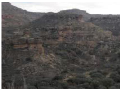
Panorámica de Serreta de Tramaced