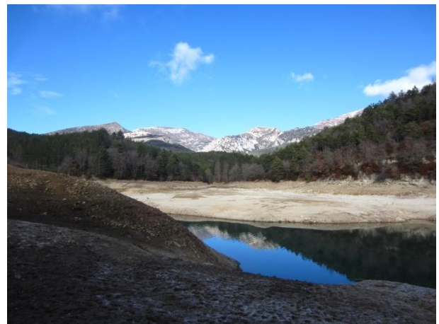
Embalse de Guara/Calcón

El lugar de Fabana llegó a tener cinco vecinos. Junto con Panzano y Sotero Raro formaba en 1295 la Honor de la Fabana, propiedad de Artal de Azlor.