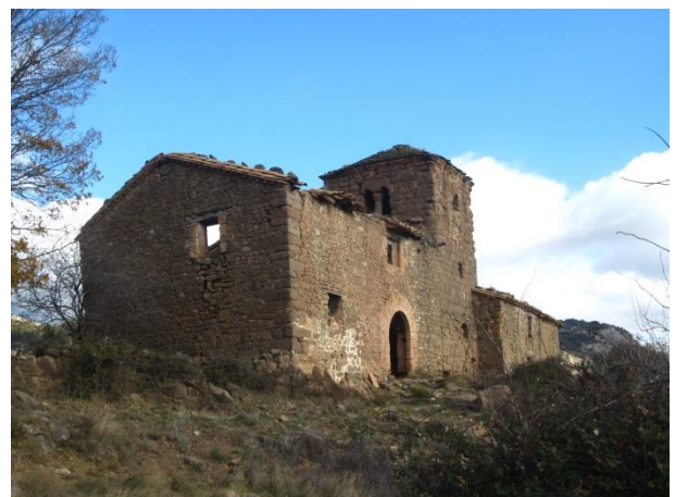
Ermita de Fabana.