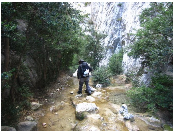
Gargantas de Fabana.