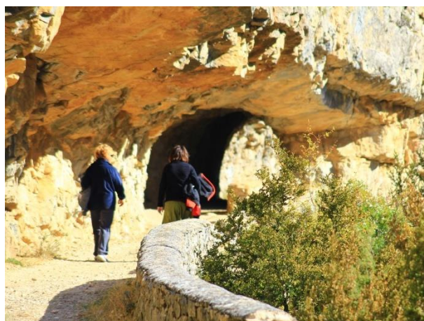
Uno de los túneles del camino.

La presa de Cienfuens se construyó para recoger el agua que se filtraba a través de las rocas calizas sobre las que se asienta la presa de Santa María de Belsué aguas arriba.