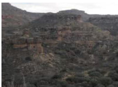
Panorámica de Serreta de Tramaced