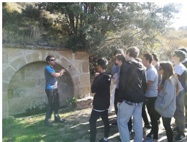
Fuente de los Huertos.

El edificio Espacio Salto de Roldán tiene un especial diseño arquitectónico por el que recibió el premio García Mercadal de Arquitectura en su 27ª edición.