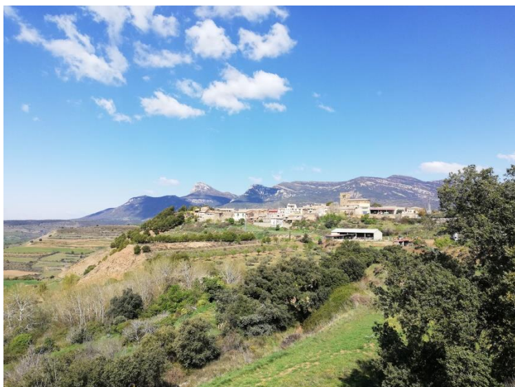
Sabayés, a los pies de la Sierra.