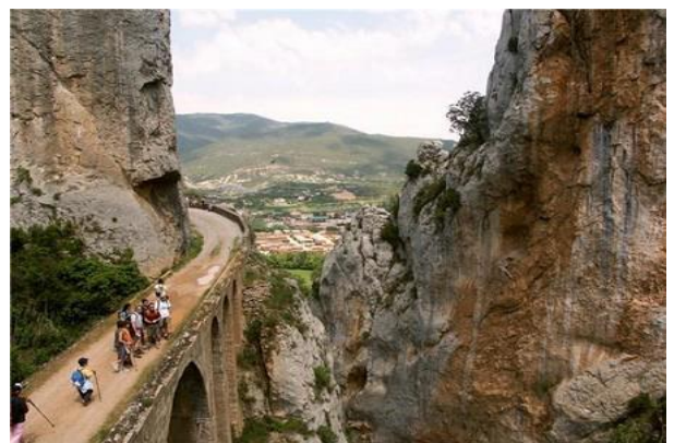
Foz de Escalete