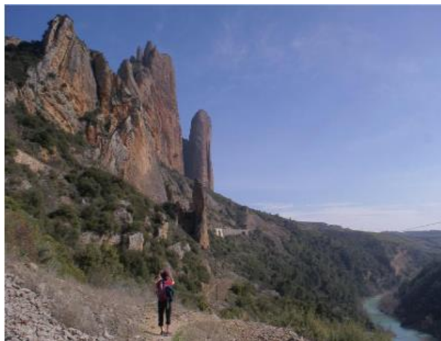
Mallos de Riglos