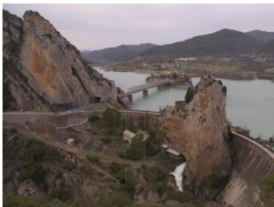
Embalse de la Peña

La ruta parte del apeadero de Riglos donde aparecen los Colosos de Riglos y Peña Rueba, durante este primer tramo podemos disfrutar de las vistas del río Gállego, las terrazas fértiles a los lados, las crestas de calizas y los gigantes de conglomerado. Iremos por un sendero que recorre el antiguo camino para pasar hacia las Galias, cruzando en algunas ocasiones las vías del tren. Durante el recorrido andamos sobre calizas, arcillas y margas formadas hace millones de años. Caminaremos hasta la presa del embalse de La Peña, descubriendo el túnel excavado sobre las calizas del mar tropical del Eoceno, para terminar en la estación de Santa María y la Peña.