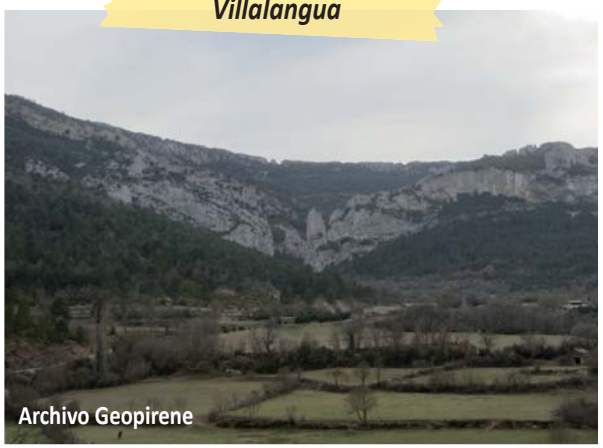
Foz de Salinas desde Villalangua