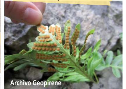
Hoja de helecho con esporas