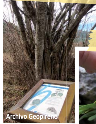
Ejemplar de avellano